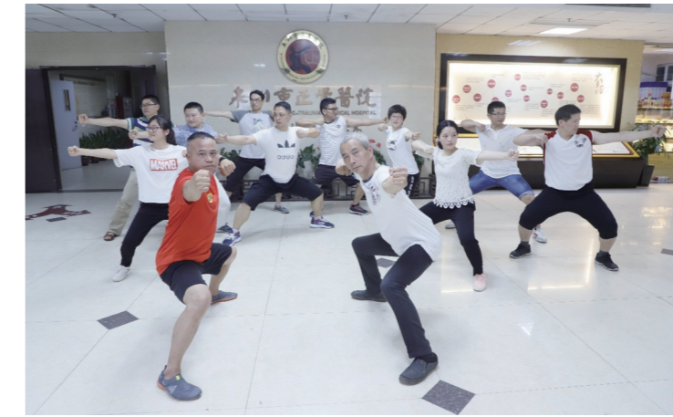
管理理念的见证。每一步,都是迈向现代医院管理制度的跨越。

尤其是运行成熟的以年度目标考核指标为指引,以岗位职责为基础,健全完善以质量为核心,以公益性为导向,以工作量、服务质量、技术能力、风险程度和医德医风等为要素的内部绩效考核机制,将考核结果与医务人员岗位聘用、职称晋升、个人薪酬、评优评先等挂钩进一步激发了员工的积极性和“当家做主”的责任感。