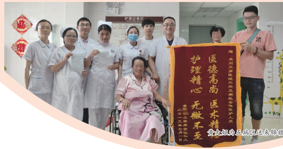
黄大姐为五病区送来锦旗