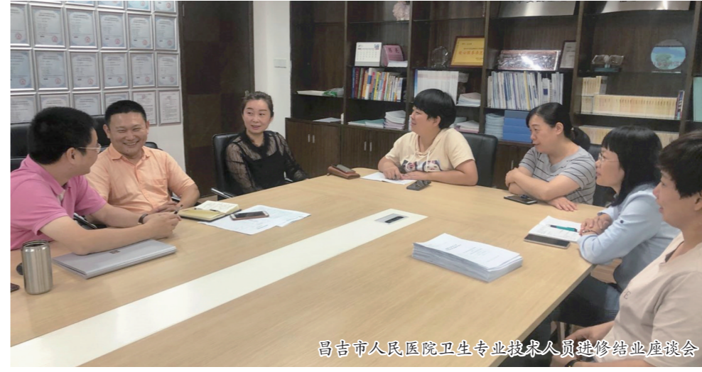
昌吉市人民医院卫生专业技人员进修结业座谈会