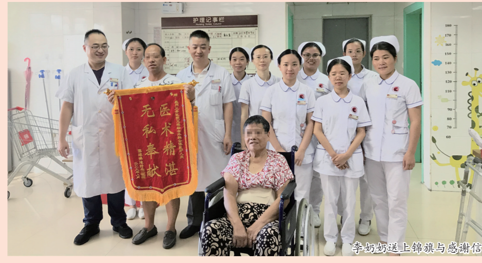
李奶奶送上锦旗与感谢信